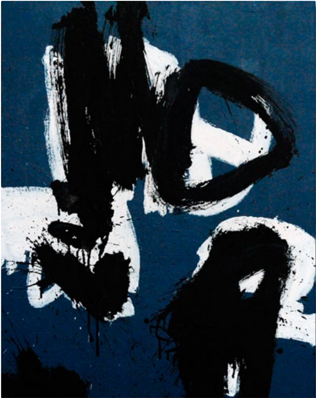
PEINTURE TURETRUC 100 x 100 cm acrylique / papier / toile