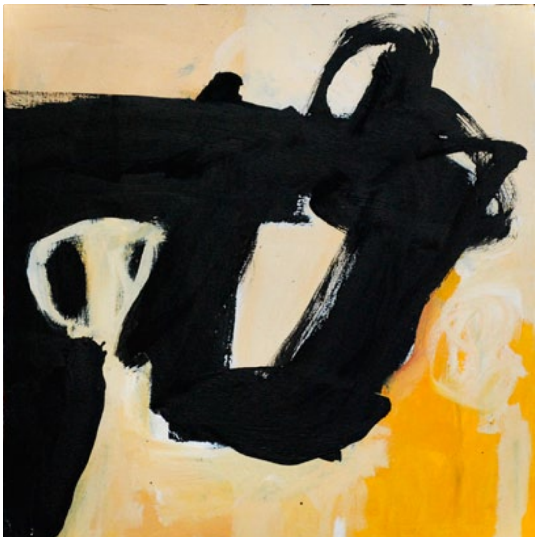
200X 100 x 100 cm acrylique / toile