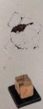
ASSEMBLAGE 2006 15 X 15 X 60 cm métal et bois