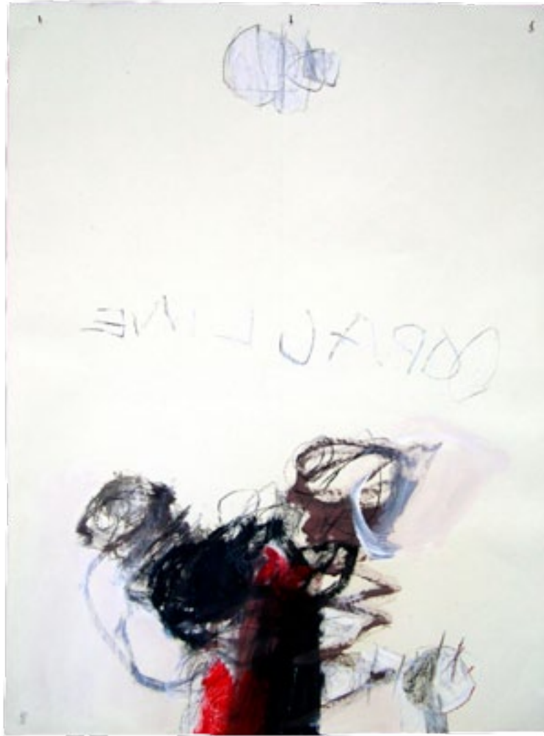
2004 80 x 60 cm acrylique / papier