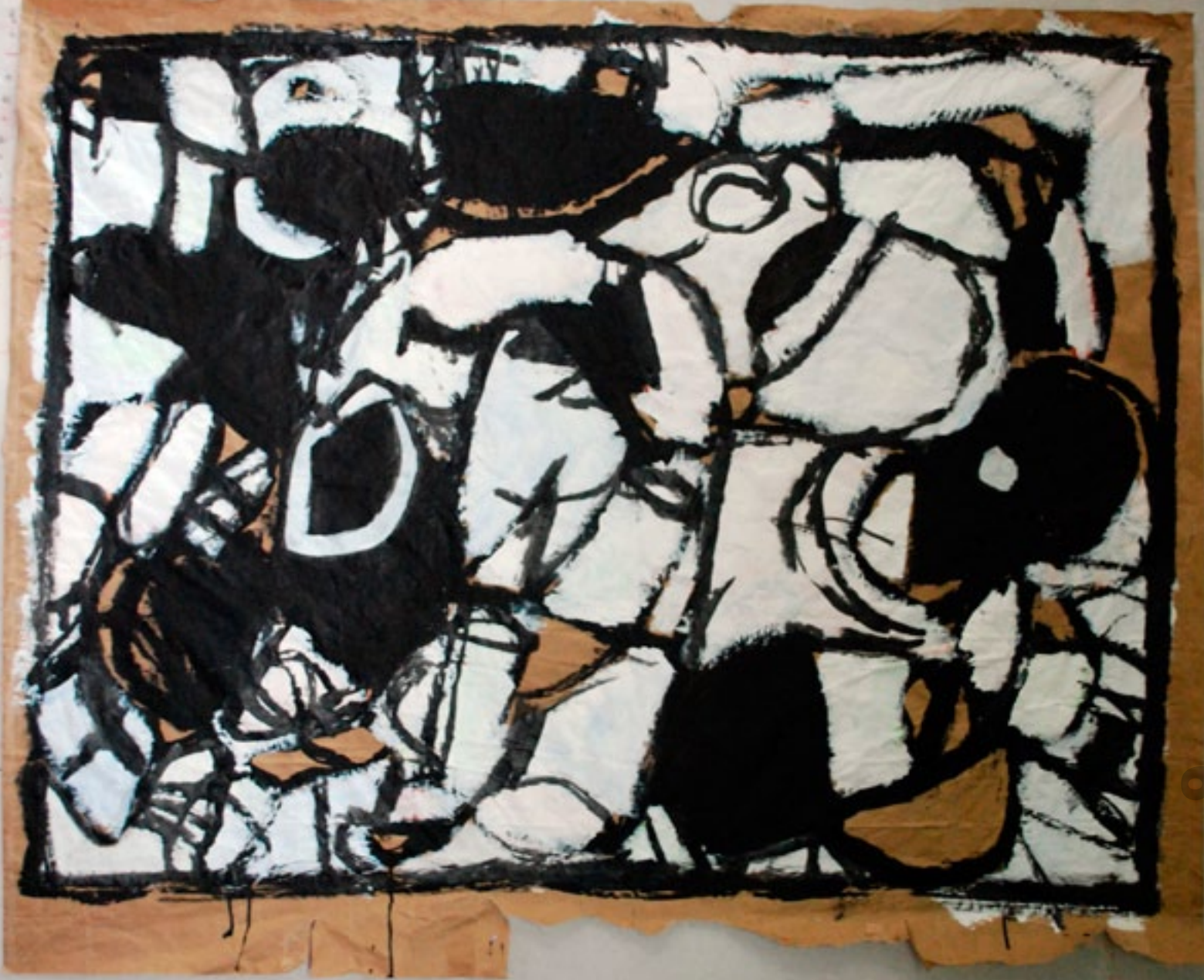
2013 100 x 70 cm acrylique / papier