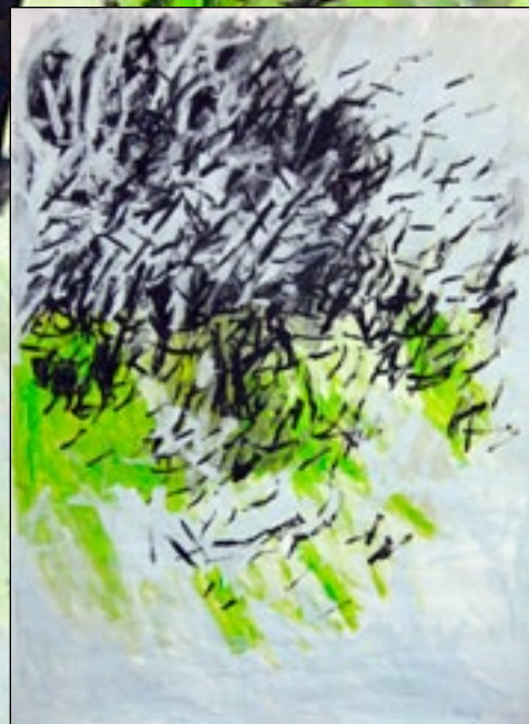
DÉTAIL 2008 original 200 x 150 cm acrylique / papier