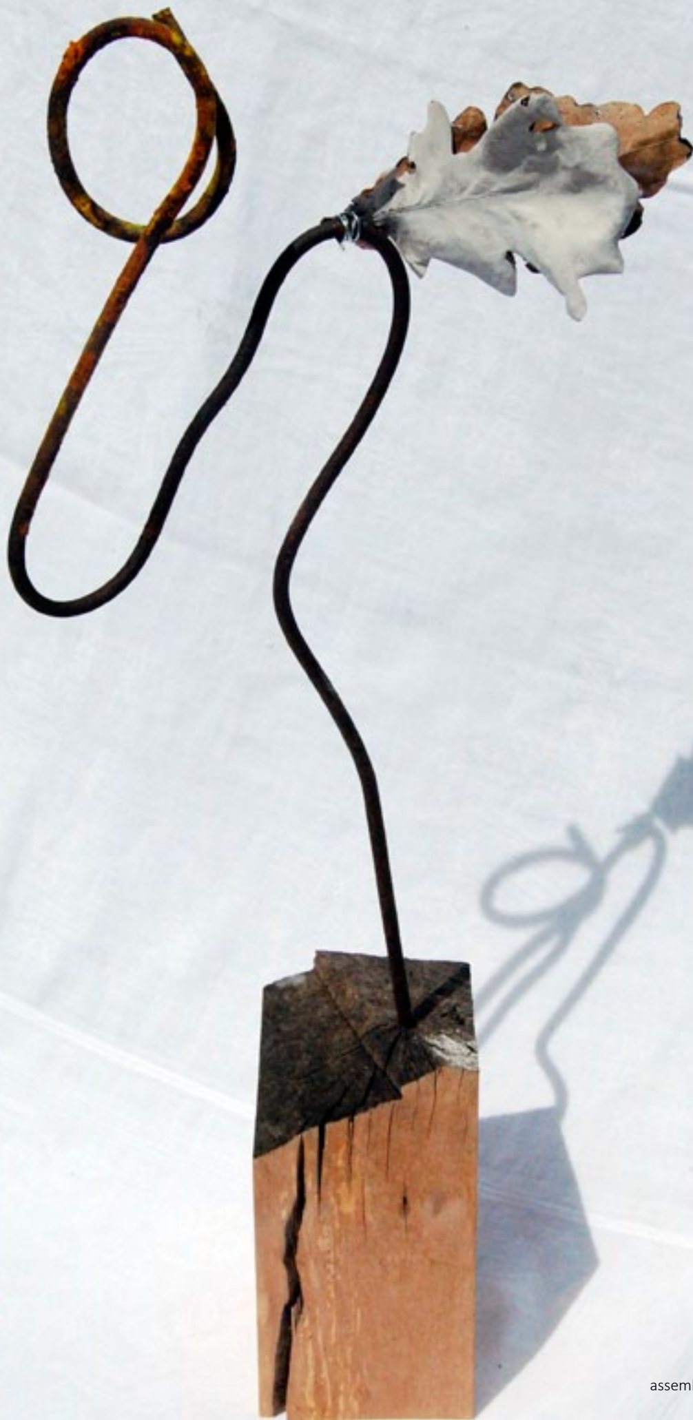
2009 12 x 12 x 80 cm assemblage bois et métal