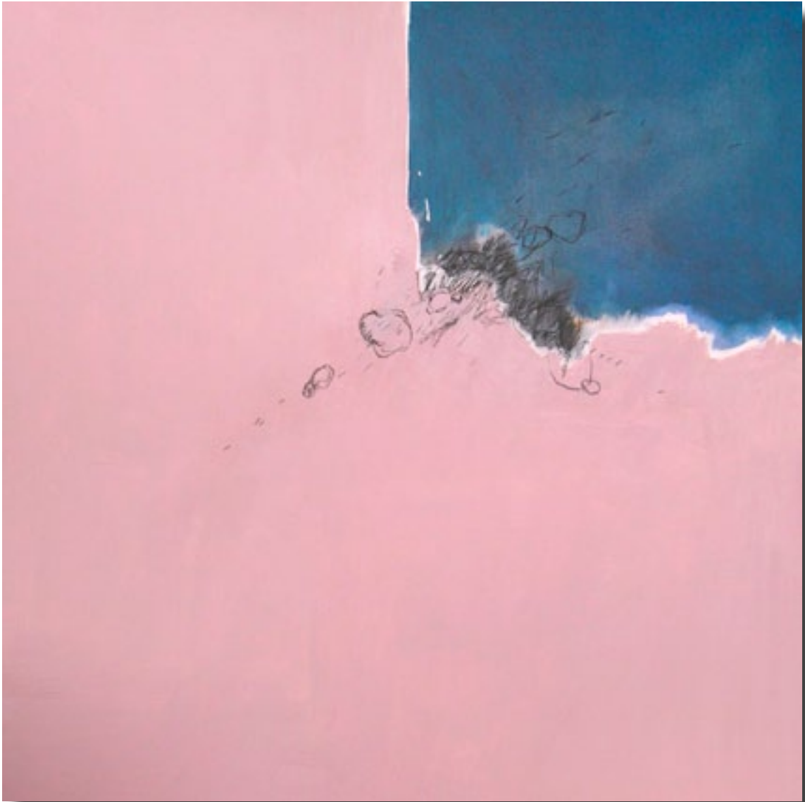
2005 120 x 120 cm acrylique / toile