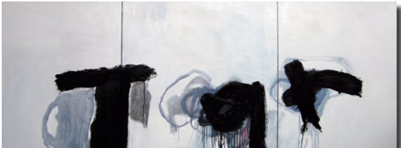
2009 triptyque - 100 x 260 cm acrylique / toile