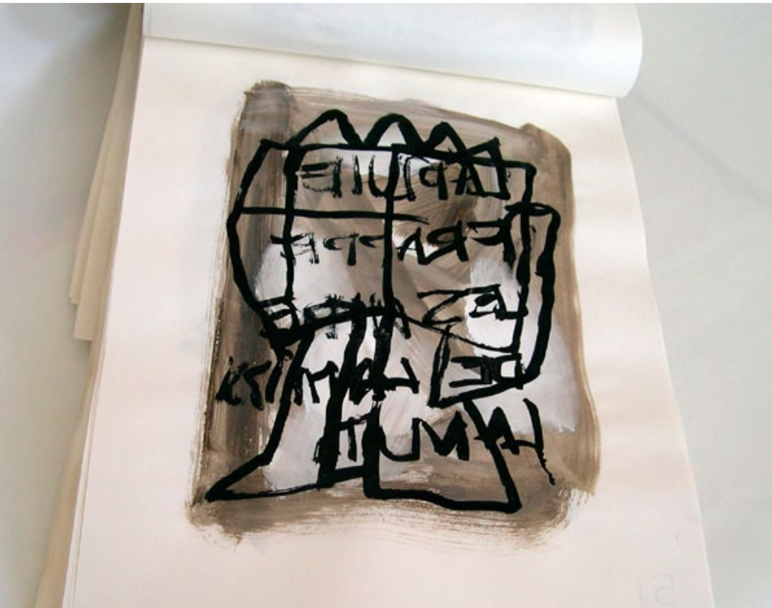
2005- LIVRE D'ARTISTE- EXEMPLAIRE UNIQUE 40 x 30 cm acrylique et mixte / papier