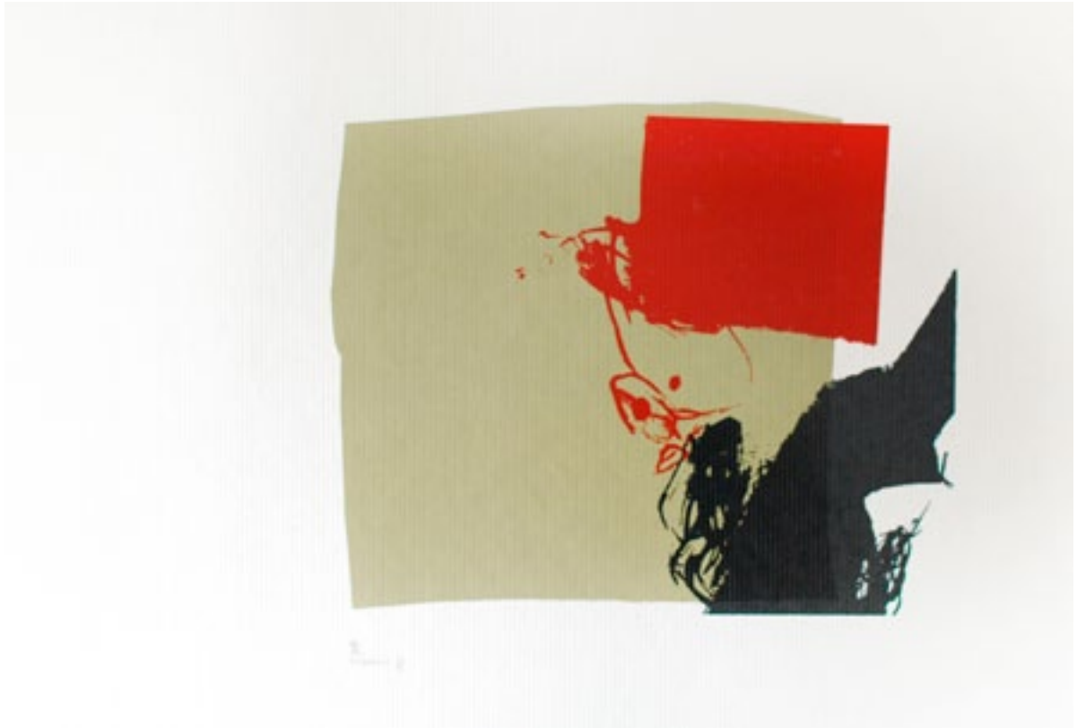
100 x 70 cm sérigraphie / pâte à papier